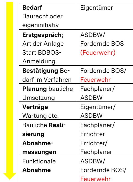
Tabelle 1: Ablauf

Insbesondere sind die fordernden BOS nicht mehr Inhaber/Berechtigte zur Nutzung der vorgesehenen Frequenzen. Dies ist beim Digitalfunk BOS die Bundesanstalt für den Digitalfunk BOS (BDBOS). Daher muss der Anmeldeprozess einschließlich Frequenzzuteilung, die vertraglichen Regelungen zur Instandhaltung und Wartung etc. nicht mehr über die fordernde BOS, beispielsweise die örtliche Feuerwehr, erfolgen. Dies übernimmt nun die ASDBW in Zusammenarbeit mit der BDBOS. Die Feuerwehr bestätigt gegenüber der BDBOS den Bedarf für eine Objektfunkanlage. Außerdem legt die fordernde BOS die aus ihrer Sicht erforderliche Art der Ausführung fest (vgl. Ausführungen oben). Bei bau-rechtlich geforderten Anlagen wird die Entscheidung in Abstimmung zwischen der nach Nr. 3 VwV Brandschutzprüfung zuständigen Stelle und der örtlichen Feuerwehr getroffen. Anschließend begleitet die Feuerwehr die Planungen und beteiligt sich an einer funktionalen Abnahme der Anlage. Damit sieht der Ablauf aus Sicht der fordernden BOS/Feuerwehr wie folgt aus: