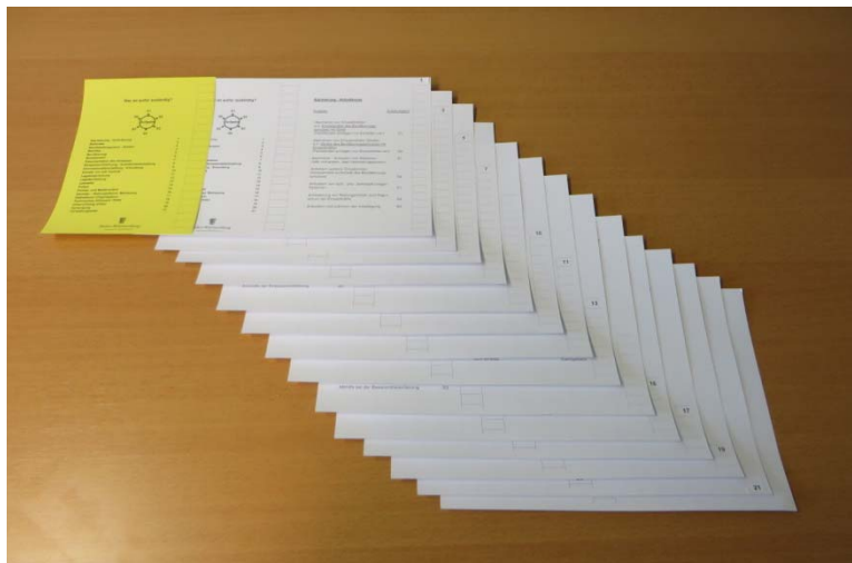
Abb. 1: Ausdruck

Es empfiehlt sich, Papier mit einem Gewicht von 130 g/m 2 auszuwählen, da es griffiger und haltbarer in der Benutzung ist. Die Verwendung des weit verbreiteten Druckpapiers mit 80 g/m 2 ist aber auch möglich. Zur besseren optischen Erscheinung kann die erste Seite farbig ausgedruckt und mit einer PVC-Folie als Deckblatt versehen werden (Abb. 1).