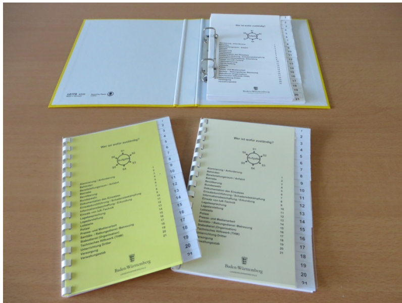
Abb. 6: verschiedene Einbände