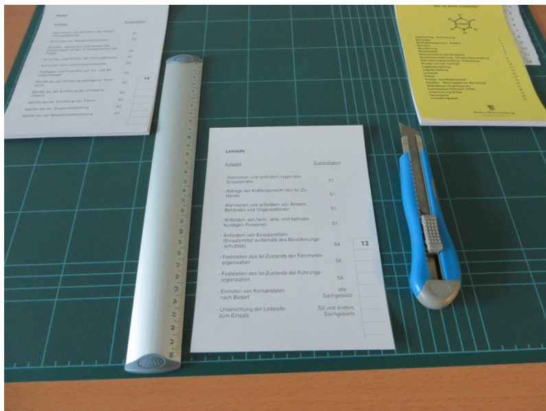
Abb. 4: vor dem Heraustrennen des Nummerungsstreifens