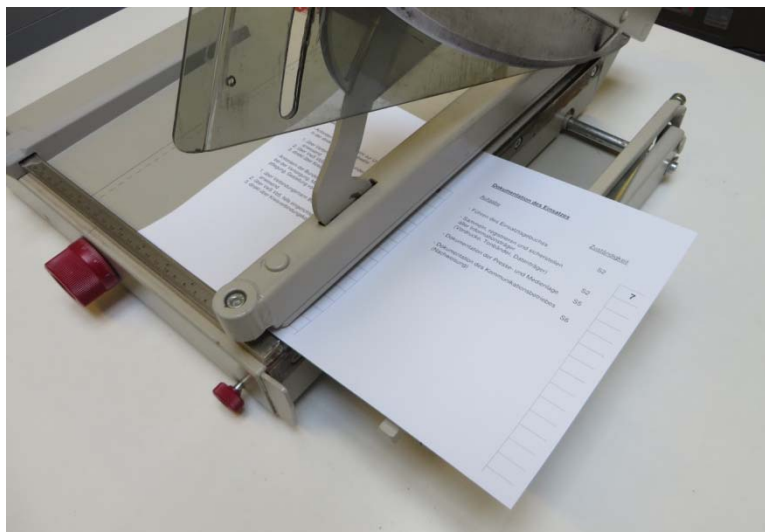
Abb. 2: Schneiden