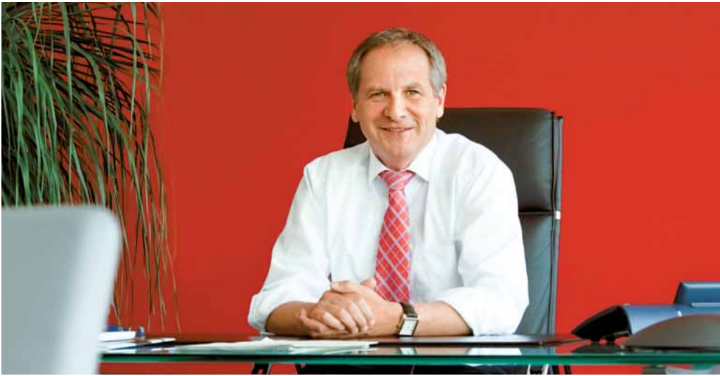
REINHOLD GALL Mdl, INNENMINISTER